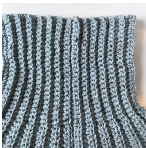
Næsten usynlig sammenhækling

I Aarhus kalder vi dem også torvevanter 😊