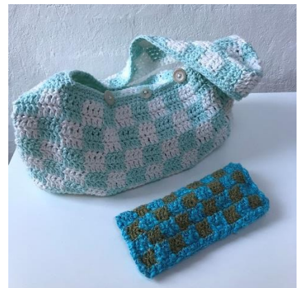
Ternet taske og brillerne klar til en bytur

thepowderedowlthepowderedowlthepowderedowlthepowderedowlthepowderedowlthepowderedowlthepowderedowlthepowderedowlthepowderedowlthepowdered